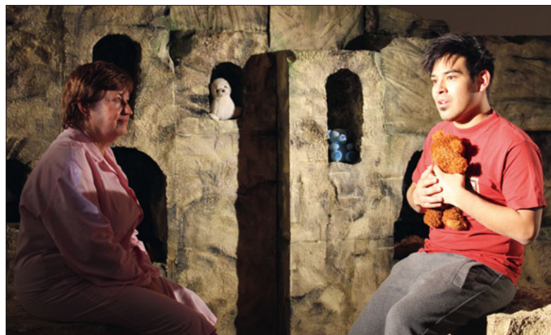
Das Theater58 führt in der Johanneskirche «Oskar und die Dame in Rosa» auf.