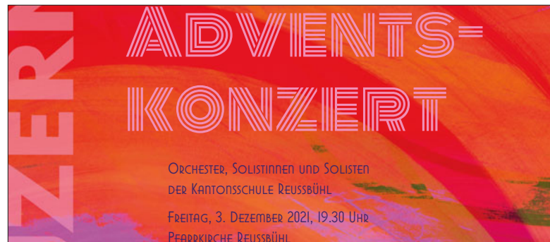
Das Adventskonzert der Kantonsschule Reussbühl verspricht ein musikalisches Ereignis zu werden.

Advent ist auch die Zeit vieler musikalischer Höhepunkte. Auf zwei davon, die in unserer Kirche stattfinden, sei hier speziell hingewiesen.