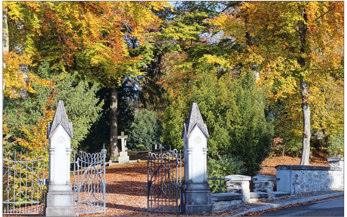
Eingang zum englischen Friedhof in Meggen an der Kreuzbuchstrasse. (31. Oktober 2021)