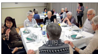
Es wurde viel gelacht und gut getafelt.

Am letzten Abend im Oktober waren die freiwillig Mitarbeitenden der Pfarrei – zusammen mit jenen, die sich beruflich engagieren – zum traditionellen gemeinsamen Nachtessen ins «Philipp Neri» eingeladen. Es war ein zauberhafter Abend.