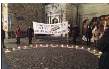
Eindrückliches Zeichen: Schweigen für den Frieden auf dem Kornmarkt.

Leise, aber kraftvoll bringt Schweigen für den Frieden zum Ausdruck, dass uns oft die Worte fehlen, um auf das Elend von Flüchtlingen, von Krieg, Hunger und Unterdrückung weltweit zu reagieren. Der Schweigekreis auf dem Luzerner Kornmarkt setzt ein Zeichen der Anteilnahme und Verbundenheit gegen die Gleichgültigkeit. Menschen mit prekärem Aufenthalt und Asylsuchenden und Sans-Papiers gilt unsere Solidarität. Wie jedes Jahr findet Schweigen für den Frieden auch in diesem Jahr in der Vorweihnachtszeit an jedem Donnerstagabend statt. DO, 25. November, 2., 9., 16. und 23. Dezember, 18.30–19.00, Kornmarkt