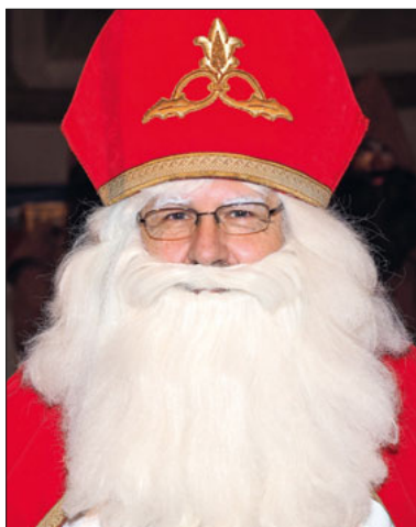
Sankt Nikolaus: Ich freue mich auf euren Besuch