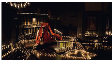
Lichtermeer in der Pauluskirche anlässlich der Nacht der Lichter.

Ende November wird die Pauluskirche durch ein Lichtermeer erhellt. Das Abendgebet mit Taizégesängen bereitet auf die kürzeren Tage und längeren Nächte vor. Die «Nacht der Lichter» lebt von den meditativen und sinnlichen Gesängen aus Taizé und der Atmosphäre des Kerzenlichtes. Sie ist eine Einstimmung auf die Advents- und Weihnachtszeit hin, eine Einladung, zur Ruhe zu kommen und neue Kraft für den Alltag zu schöpfen. Alle sind zu diesem speziellen ökumenischen Abendgebet mit Taizégesängen im Lichtermeer eingeladen. SA, 20. November, 19.00 Einsingen mit dem Taizé-Chor, 19.30 Beginn des Abendgebetes, Kirche St. Paul, anschliessend Möglichkeit zur Begegnung in der Teestube, Zertifikatspflicht