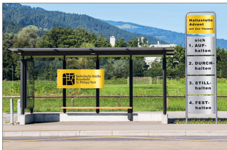
Wir wollen anhalten und über wichtige Fragen des Lebens nachdenken.

Rorate ist ein besonderer Gottesdienst im Advent. Fröhlich morgens vor der Arbeit oder