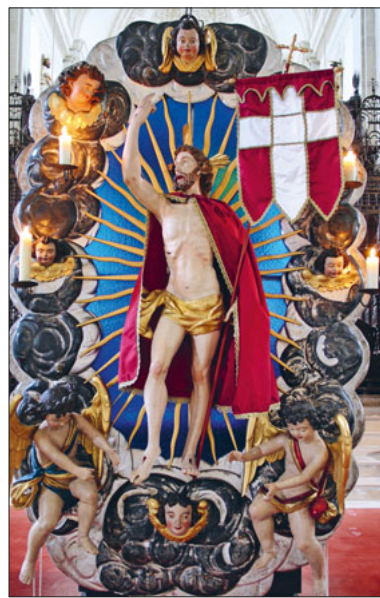
Darstellung des auferstandenen Christus (Pfarrei St. Leodegar im Hof).