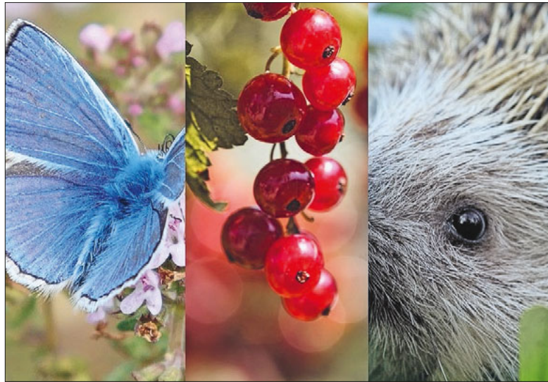
Unkonventionelle Gärten und vielfältige Gartenphilosophien.

Ein Sonntagsspaziergang gibt Einblick in drei Privatgärten im Wesemlinquartier und in verschiedene Gartenphilosophien.