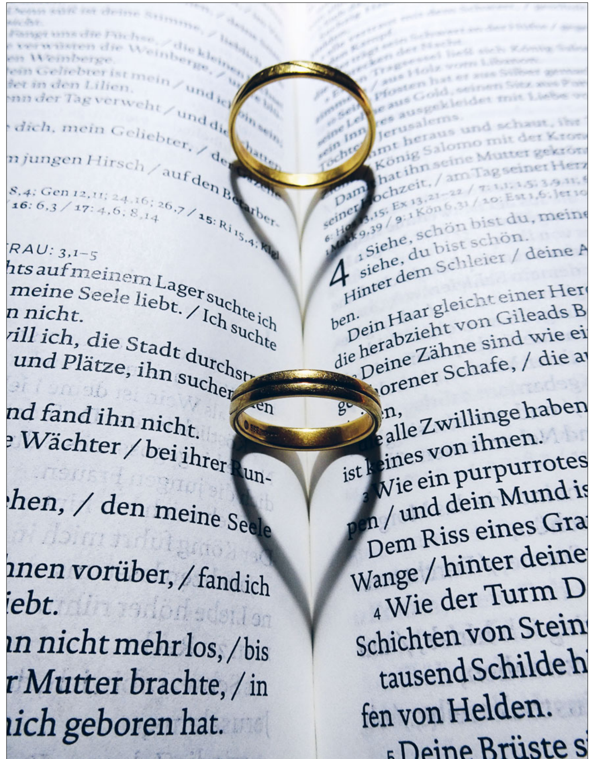
Immer weniger Paare versprechen sich vor Gott die Treue.

Seit mehr als 500 Jahren findet der Musegger Umgang, damals eine Prozession, statt. Der Anlass war gleichbedeutend wie eine Wallfahrt nach Rom und mehrere Tausend Personen nahmen daran teil. Der Umgang findet am 5. Mai statt. Seite 15 und Pfarreiseiten