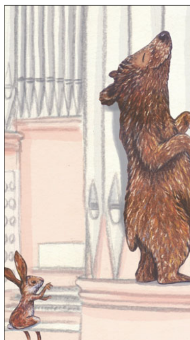
Der Bär lauscht der feinen Melodie, die der Hase spielt. Bild: Kathrin Schärer

Treffpunkt: SA, 11. Mai, 10.30 Uhr, beim Haupteingang vor der Jesuitenkirche Luzern; Eintritt frei, Kollekte Keine Anmeldung erforderlich