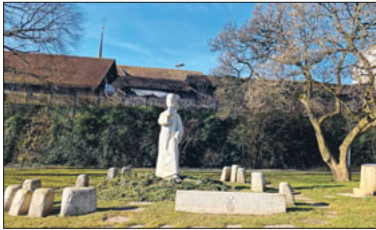
Bruder Klaus und Friedensstein in Solothurn.