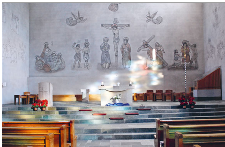
Darstellung der Auferstehung Jesus in der Pfarrkirche St. Theodul in Littau.

Himmelfahrt Christi bedeutet, dass Jesus zum Vater heimgegangen ist, dass er von ihm aufgenommen worden ist und uns den Heiligen Geist gesandt hat.