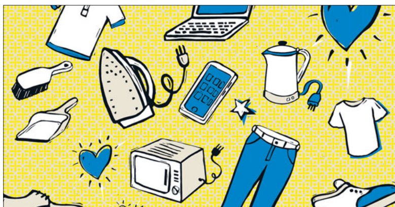
Sachspenden für Flüchtlinge gesucht. Grafik: Filip Erzinger

Konkret werden folgende Sachspenden gesucht: Hygieneartikel, Küchenelektrogeräte (Wasserkocher, Toaster, Mikrowelle und so weiter), Küchenutensilien (Geschirr, Besteck, Pfanne, Topf und Ähnliches), Föhn, Bügeleisen, Bügelbrett, Regenschirm, Nachtlampen, Handy, Laptop, Drucker, Frauen- und Männerschuhe (bitte nur paarweise), Frauen- und Männerkleider (auch in grossen Grössen), Möbelstücke (nur nach Vereinbarung). Für Kinder: Winter-