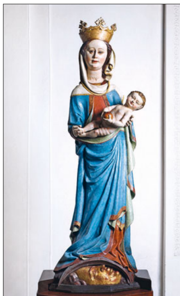
Marienstatue um 1450 in der Jesuitenkirche.