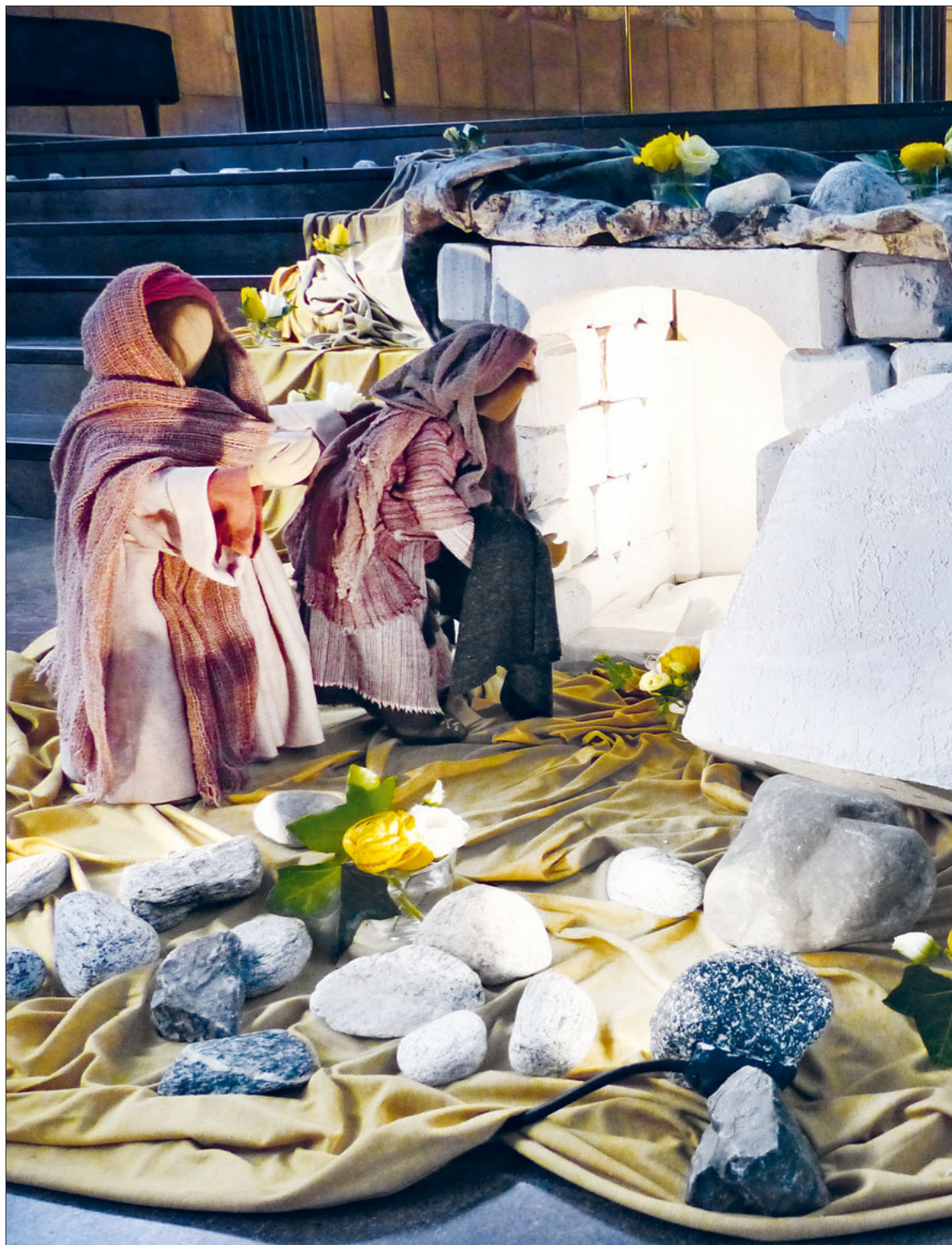
Das Grab ist leer. Darstellung mit biblischen Figuren in der Kirche St. Karl (2020).

Die Kinder der Pfarreien im Pastoralraum Stadt Luzern feiern in den nächsten Wochen ihre Erstkommunion. Seite 13 bis 17