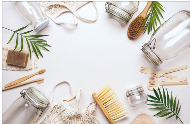
Ökologische Alternativen zu Plastik.

Was haben eine PET-Flasche, eine Regenjacke und Sonnencreme gemeinsam? Alle Produkte enthalten Plastik. Plastik und vor allem auch Mikroplastik lassen sich überall finden, egal wie abgelegen ein Ort ist. Doch welche Auswirkungen hat Plastik auf die Umwelt und nicht zuletzt auf das Klima? «Plastikfrei – wir sind dabei!» lautet das Thema des diesjährigen Wettbewerbs von Faires Lager. Führt mit euren Lagerteilnehmer:innen eine Aktivität zum Thema (Mikro-)Plastik durch. Behandelt mit ihnen, woher Mikroplastik kommt und warum es wichtig ist, diesen zu vermeiden. Ob als Planspiel, als Lagersportblock oder als kreative Aktion – sucht gemeinsam nach Lösungen für eine Welt mit weniger Plastik. Teilnehmen können alle Jugendlager, welche zwischen dem 1. April und dem 31. August während mindestens drei