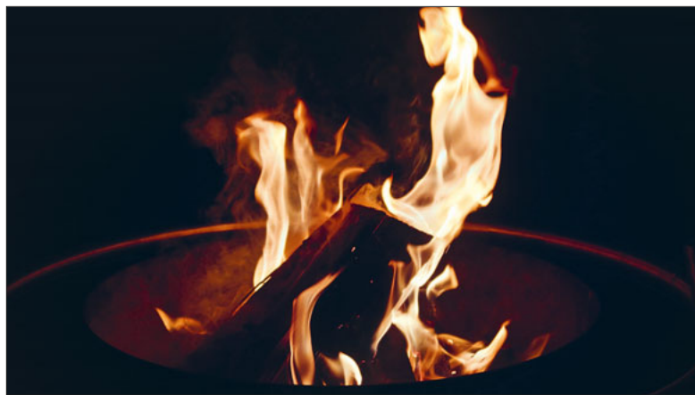
Feuer und Flamme: unser Motto der Firmung.

So lautet das Motto der diesjährigen Firmung. Wenn ich für etwas «Feuer und Flamme» bin, lasse ich mich begeistern. Wofür lässt du dich begeistern? Was ist dir wichtig?