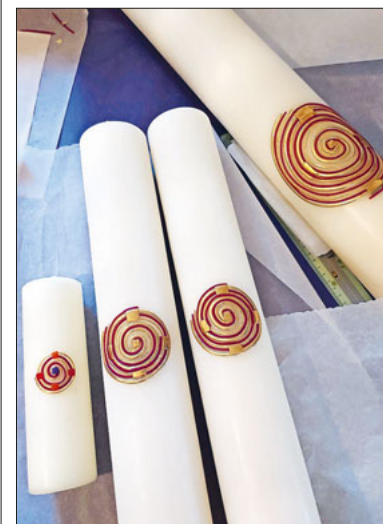
Die grossen und kleinen Osterkerzen mit dem neuen Motiv.

Die Ministrant:innen MaiHof haben unter Anleitung und Hilfe von Yvonne Blaser wiederum schöne Osterkerzen verziert (siehe Artikel links). Die Osterkerzen werden im Gottesdienst in der Osternacht gesegnet. Die diesjährigen, kleinen Osterkerzen können anschliessend für zehn Franken gekauft werden.