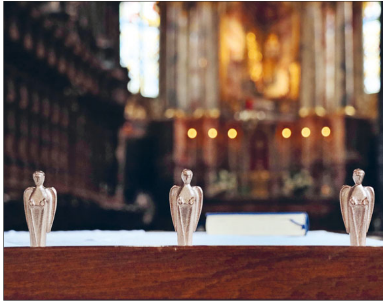
Engel auf dem Altar der Franziskanerkirche.

Der kleine Bronzeengel bekommt eine schöne Aufgabe. Er kann Gottes Botschaft überbringen, er kann uns behüten und beschützen und ein Geschenk sein.