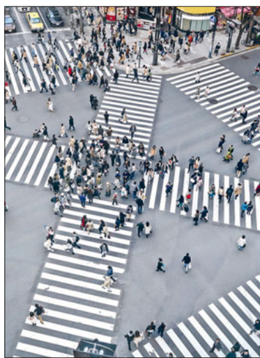
Kreuzweg.