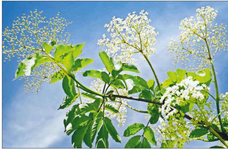
Holunderblüten, die zum Pflücken einladen.

Auf dem Gelände unserer Pfarrei entsteht ein vielfältiger, bunter Lebensraum mit einheimischen Pflanzen – für Insekten, Vögel und uns Menschen.