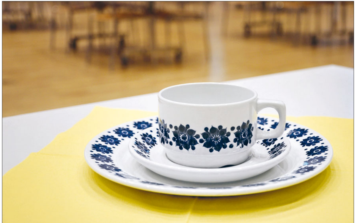
Ein halbes Jahrhundert alt und noch immer im Einsatz.