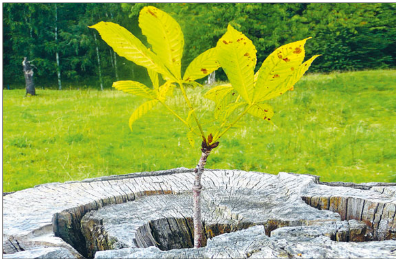
Neues Leben.

In diesen Tagen feiern wir, dass das Leben stärker ist als der Tod, Todgeweihtes zum Leben erweckt wird.