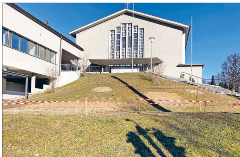
Hier entsteht eine artenreiche Blumenwiese. Foto: Cristina Perrenoud, Februar 2023

Mehr Vielfalt, mehr einheimische Pflanzen und damit mehr Lebensraum für Tiere – dies ist das Credo für die Grünflächen in beiden Pfarreien.