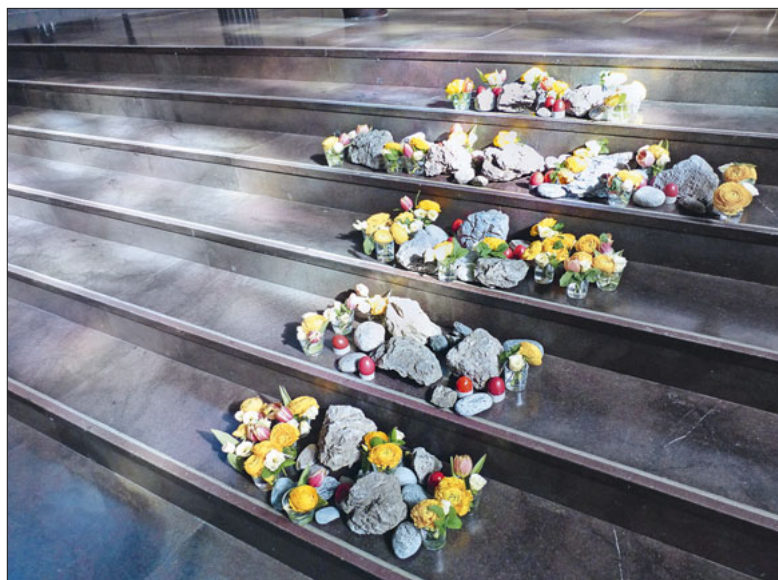
Osterkreuz in der Kirche St. Karl (2022).

Wenn die Welt Kopfsteht der österlichen Kraft Raum geben.