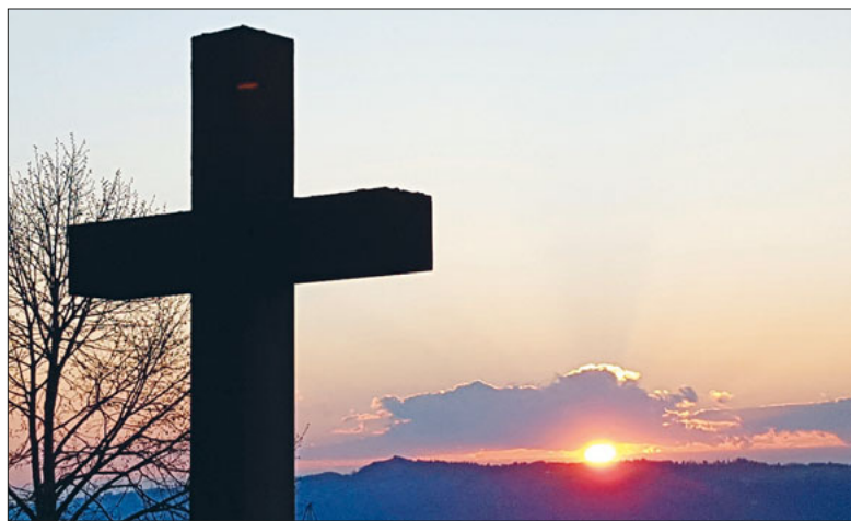
Sonnenaufgang auf dem Michaelskreuz.

Die vier Evangelisten sind sich einig: Die Frauen kamen am frühen Morgen des ersten Wochentags zum Grab Jesu und fanden es leer.